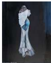
Aquarelle sur carton - Femme de dos 20,00 EUR