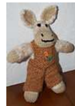
DOUDOU EN LAINE - Oscar, l'âne jardinier 30,00 EUR