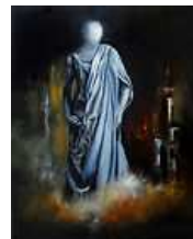
Elza ne se souvient plus - Tableau de... 125,00 EUR Livraison gratuite