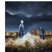
TABLEAU - IL DEVRA REPENDRE -... 65,00 EUR Livraison gratuite