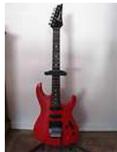
Guitare électrique IBANEZ Type S 440 122,00 EUR