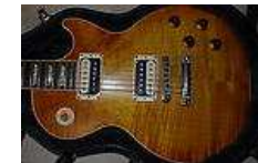
GIBSON Les Paul Standard 2005 Faded... 1.700,00 EUR