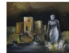
TABLEAU DE GARNIER-LAFOND -... 85,00 EUR Livraison gratuite