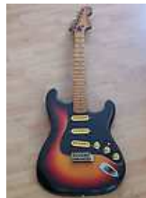
Guitare electrique de marque buddy 169,00 EUR