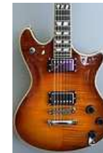
GUITARE ELECTRIQUE 899,00 EUR Livraison gratuite