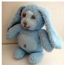
DOUDOU EN LAINE - BOUBOULE le lapin 30,00 EUR