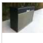
ampli lampes guitare Marshall ...