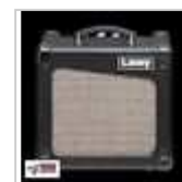
AMPLI LANEY CUB 8 CUB8 GUITARE ...