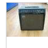
RARE vendis ampli lampe ROLAND BOLT 30w