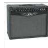
AMPLI GUITARE ELECTRIQUE PEAVY VALVEKING 112