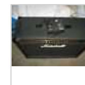
Ampli Marshall JCM900 4502 (2*50W) Combo ...