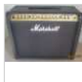
Ampli Guitare Marshall VS100R