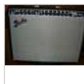
Ampli Fender Twin Reverb