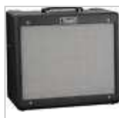
ampli lampe fender blues junior 3