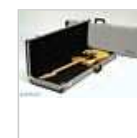
ETUI FENDER Deluxe Black Tweed STRAT ...