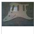
Pickguard Fender Strat '58 White 1 ply