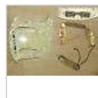
FENDER VINTAGE MUSTANG DUO SONIC