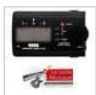
ACCORDEUR KORG CA-30 CHROMATIQUE ...