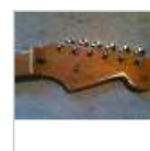
Manche Fender Strat '57 Ri made in Japan